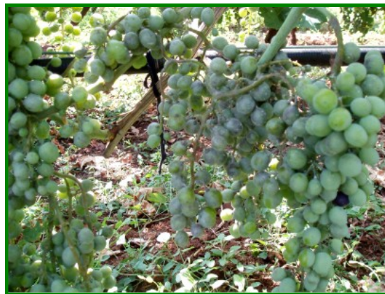
pepelnica na grožđu

Quadris i Cabrio top djeluju na obje bolesti.