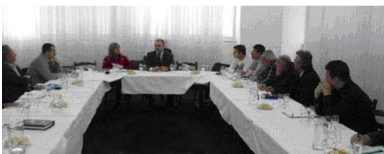
Sl. 1 - Učesnici seminara "Osnovi vinske kulture"

Likerska vina su specijalna vina dobijena vrenjem šire uz dodatak alkoholizirane šire, vinskog destilata ili vinskog alkohola.